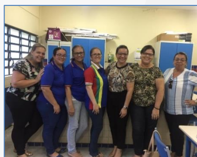
Formação de Língua Portuguesa 2º bimestre (Gameleira)