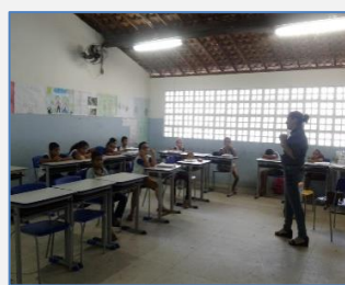
Belém de Maria