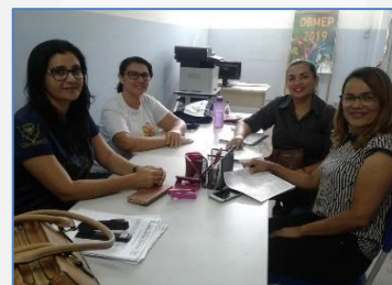
Belém de Maria