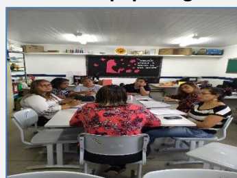
GRE Mata Sul

“Um dos maiores danos que se pode causar a uma criança é levá-la a perder a confiança na sua própria capacidade de pensar.” (Emília Ferreiro)