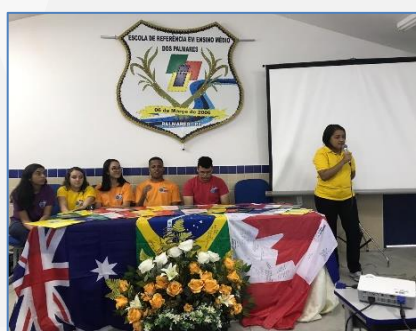
Formação PGM – 2019.2