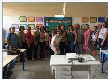
Formação de Biblioteca (Barreiros)