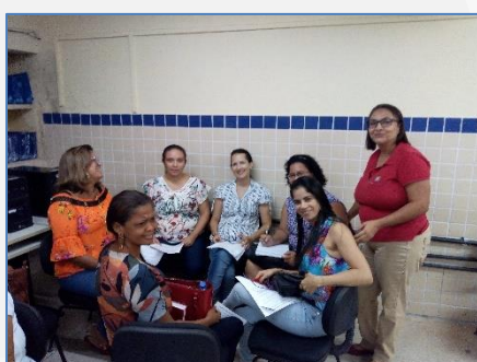
Formação de Língua Portuguesa 2º bimestre (Barreiros)