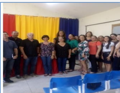
Formação de Direitos Humanos