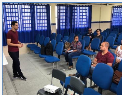
Formação de Ciências Formação