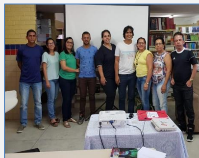
Formação Matemática (Quipapa)