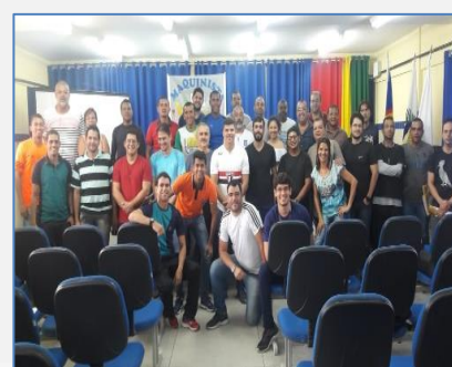
Formação de Educação Física (Palmares)