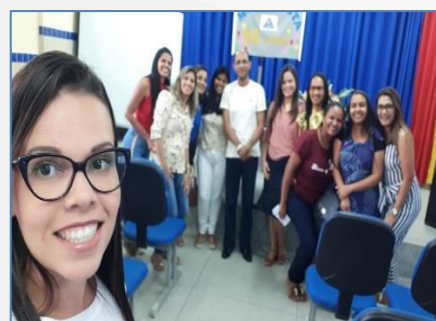
Formação com os professores Intérpretes e S.R.M.