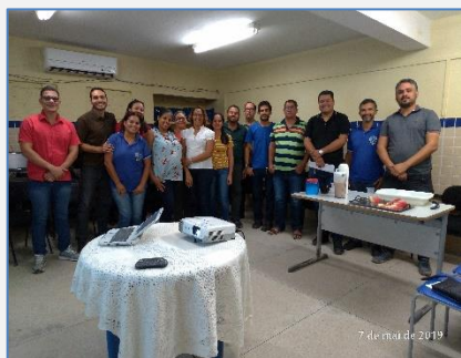
Formação de Matemática

A unidade de acompanhamento do Ensino Fundamental Anos Finais e Ensino Médio, tem como meta, desenvolver ações de fortalecimento das aprendizagens, oferecendo formações aos professores, acompanhamento dos programas e projetos, assistência às escolas prioritárias, tendo como base os resultados das avaliações externas, visando, a melhoria dos índices educacionais das escolas jurisdicionadas a GRE Mata Sul.